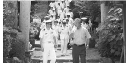
飛鳥坐神社参拝(試験艦あすか乗員) 石舞台を案内