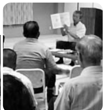
10/25 (土) 淡路島へ行ってきました