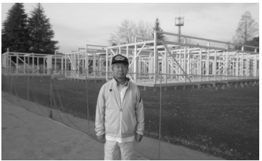
南三陸町歌津中学校グラウンド内仮設住宅建設現場にて

「連休が終わったたら、一ヶ月遅れの入学式・始業式があるが、通学バスがない。子供達に、瓦礫の中を長い距離歩