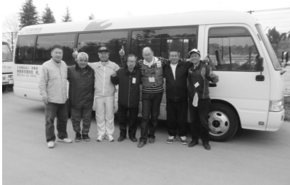
お届けしたバスと校長先生(中央)森医師(中央右)南三陸町の皆さんと

郡・檀原市選挙区で二期目、通算四期目の選挙、皆様の絶大なご支援を頂き、トップ当選をさせていただいたことを